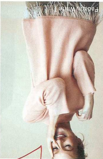
Federh White 1