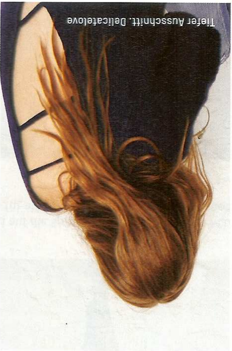
Tiefer Ausschnitt, Delicatelove

Cashmere bleibt einer der starken Umsatzgaranten im Premium-Segment. Gerade in diesem kalten, verregneten Frühjahr sorgte Strick erneut für verlässliche Umsätze. Ob immer noch das Cape oder lässige Hüllen-jacken. Jetzt wird die Masche weitergedreht, im wahrsten Sinne des Wortes. Neue Garne, feinere Teilungen, markante Strukturen, sportive Rippen, subtile Minderungen gehören zu den Innovationstrends. Aber auch an kleineren Details haben die Kreativ-ven massiv gearbeitet. Allen voran neue Ausschnitt- und Ärmellösungen verleihen Strick ein neues Gesicht. Angeschmitten Turtlenecks treffen auf tiefe Rückendekolletees. Ärmel zeigen sich oft weiter und teils ausgestellt. Und auch Cold-Shoulder- und Off-Shoulder-Varianten werden in Masche übersetzt und sorgen für neue Must-have-Gefühle. Schlitzte bleiben unverzichtbar. Sie werden neu eingesetzt, nicht zuletzt für einen offeneren, geschlitzten Rücken, der Haut blitzen lässt. Aber auch Deko-Elemente setzen neue Akzente. Das können Schnürungen, Ösen, Pailletten genauso sein wie Schmucksteine oder mitunter Federn. Und schließlich macht auch der Athleisure-Trend vor der Masche nicht Halt. Sportive Pullunder, Poloshirts im Retro-Tennis-Look und Joggsyles finden sich in vielen Kollektionen.