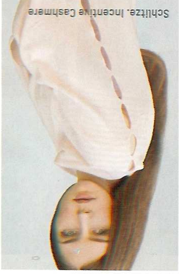
Schlitzte, Incentive Cashmere

Cashmere bleibt einer der starken Umsatzgaranten im Premium-Segment. Gerade in diesem kalten, verregneten Frühjahr sorgte Strick erneut für verlässliche Umsätze. Ob immer noch das Cape oder lässige Hüllen-jacken. Jetzt wird die Masche weitergedreht, im wahrsten Sinne des Wortes. Neue Garne, feinere Teilungen, markante Strukturen, sportive Rippen, subtile Minderungen gehören zu den Innovationstrends. Aber auch an kleineren Details haben die Kreativ-ven massiv gearbeitet. Allen voran neue Ausschnitt- und Ärmellösungen verleihen Strick ein neues Gesicht. Angeschmitten Turtlenecks treffen auf tiefe Rückendekolletees. Ärmel zeigen sich oft weiter und teils ausgestellt. Und auch Cold-Shoulder- und Off-Shoulder-Varianten werden in Masche übersetzt und sorgen für neue Must-have-Gefühle. Schlitzte bleiben unverzichtbar. Sie werden neu eingesetzt, nicht zuletzt für einen offeneren, geschlitzten Rücken, der Haut blitzen lässt. Aber auch Deko-Elemente setzen neue Akzente. Das können Schnürungen, Ösen, Pailletten genauso sein wie Schmucksteine oder mitunter Federn. Und schließlich macht auch der Athleisure-Trend vor der Masche nicht Halt. Sportive Pullunder, Poloshirts im Retro-Tennis-Look und Joggsyles finden sich in vielen Kollektionen.